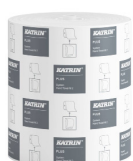
82537 Katrin Plus System Handtuchrolle