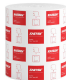
460102 Katrin System Handtuchrolle M 2-lagig