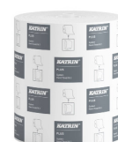
460058 Katrin Plus System Handtuchrolle M 445 Blatt 2-lagig