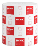
460201 Katrin System Handtuchrolle M 1-lagig