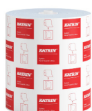
460263 Katrin System Handtuchrolle M 2-lagig, Blau