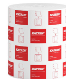
58198 Katrin System Handtuchrolle M 2-lagig