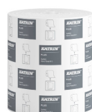
38015 Katrin Plus System Handtuchrolle M 3-lagig