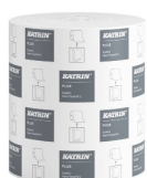
57795 Katrin Plus System Handtuchrolle M 2-lagig