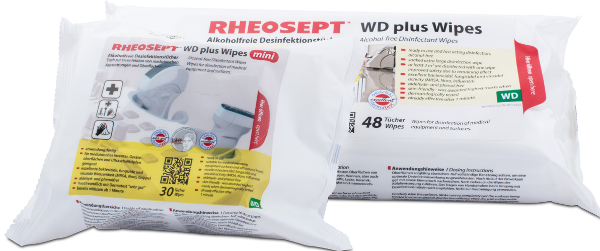
Dieses Medizinprodukt ist CE zertifiziert (CE 0481)

Getränkte alkoholfreie Desinfektionstücher mit sehr guter und gleichzeitig materialschonender Reinigungswirkung. Wirksam bereits nach 1 Minute. Für wasserfeste Oberflächen (auch Acrylglas) und medizinischem Inventar im Sinne des Medizinproduktegesetzes (MPG) geeignet. Angenehme Geruchseigenschaften. Volle Wirkstoffabgabe zur Sicherstellung der Desinfektionswirkung (kein Wirkstoffverbrauch im Tuch). Hochwertige Tuchqualität mit besonderer Speicherkapazität in verschiedenen Größen. Geeignet für medizinisches Instrumentarium und Kleinflächen als RHEOSEPT-WD plus Wipes mini. Zur Desinfektion größerer Flächen (patientennahes Umfeld) mit mind. 3m 2 mit den RHEOSEPT-WD plus Wipes. Praktische Tuchentnahme und Wiederverschluss durch Klebelasche ohne Produktberührung möglich. Kein schneller Wirkverlust durch Austrocknung.